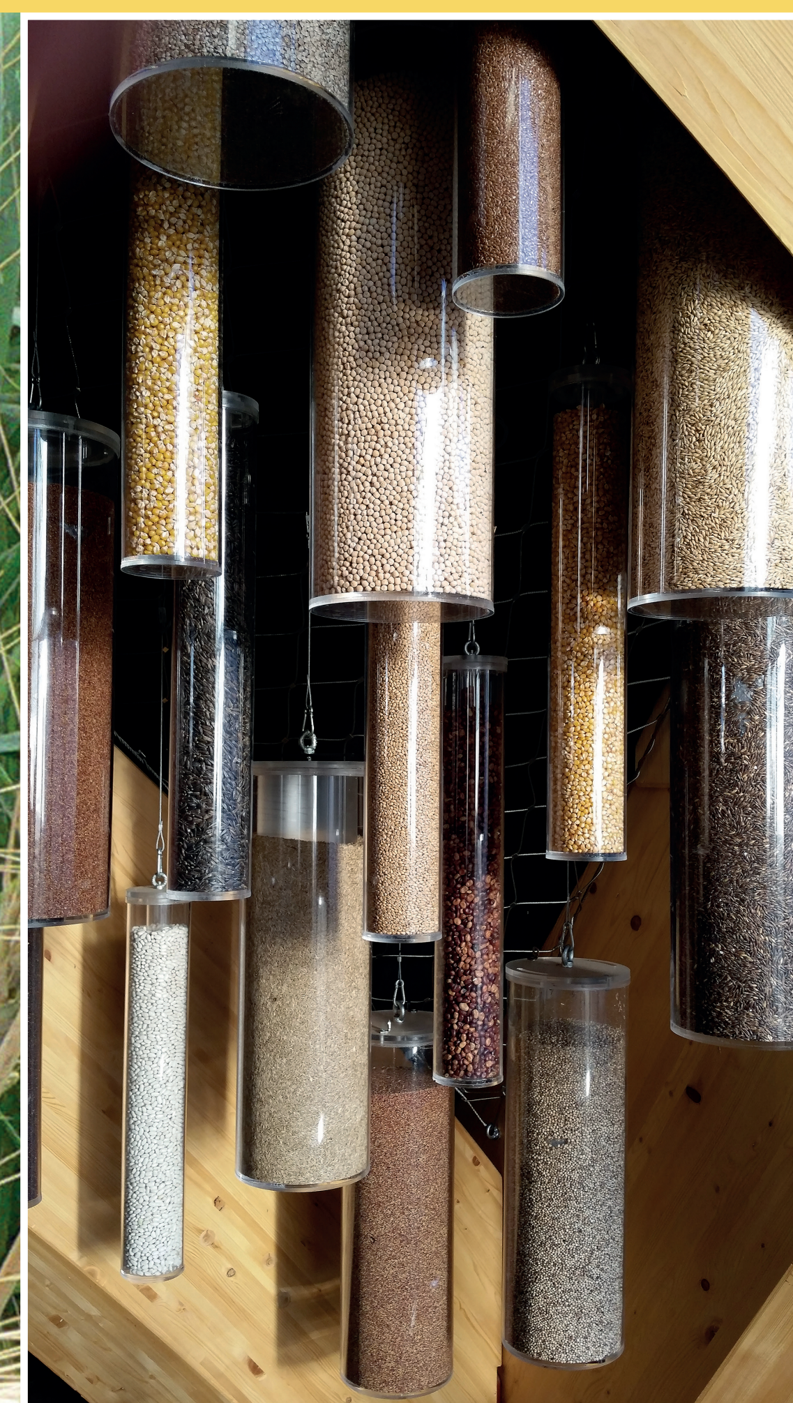
Diversi tipi di cereali